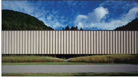
香北町立やなせたかし記念館 詩とメルヘン絵本館