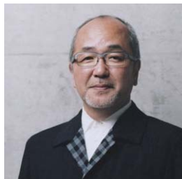
古谷誠章（ふるや・のぶあき）

書名 | 『NOBUAKI FURUYA, 179 WORKS 1979 > 2013』 定価 | 3,800円 + 税 総頁 | 252頁 判型 | W249mm x H278mm 言語 | 日本語および英語 発行日 | 2014年5月 発行所 | 建築メディア研究所 ISBN978-4-907045-12-8