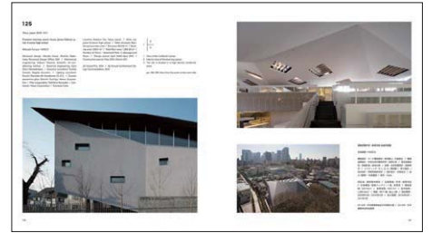
実践学園中学・高等学校 自由学習館