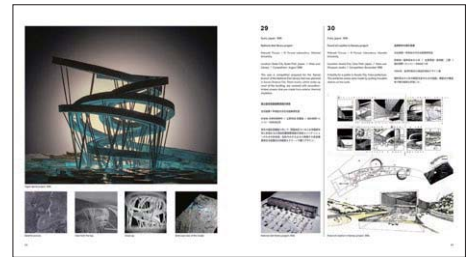
ハイパー・スパイラル・プロジェクト (左頁)