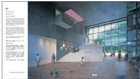
香北町立やなせたかし記念館 アンパンマンミュージアム